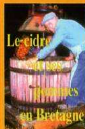
"LE CIDRE ET SES POMMES EN BRETAGNE"

Association "Les Mordus de la Pomme" : Renseignements, adhésions,... sur le stand.